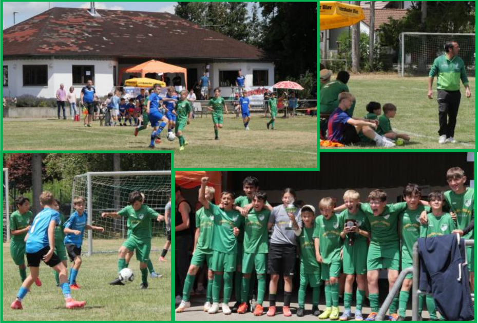
FCW—SGM Pfeffingen Onstmettingen