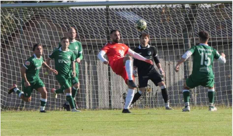
FCW—Fatih Spor Spaichingen 4:0

Korn, Recycling, Unter dem Malesfelsen 35-45, 72458 Albstadt